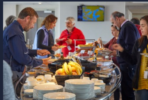
Our Excellent Dinner with Variety of Dishes