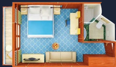
Main Deck Suite