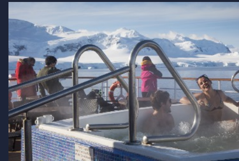
Hot Tub on Deck