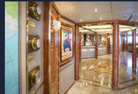
Our Team at Your Service