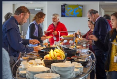
Our Excellent Dinner with Variety of Dishes