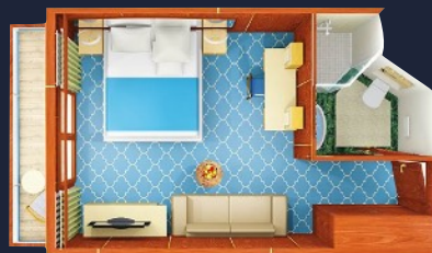
Main Deck Suite